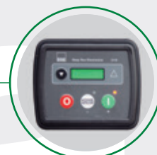
Controlador electrónico con sensor crepuscular